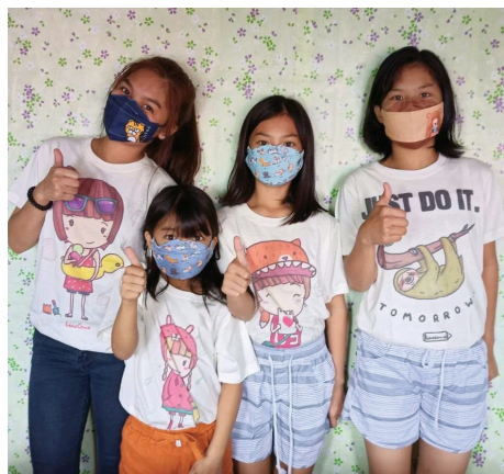
(Da sinistra a destra) I nostri giovani di Noveleta si divertono a distribuire i pacchetti natalizi del Progetto Noche Buena. I nostri bambini indossano le magliette Linecense e le mascherine 3D.