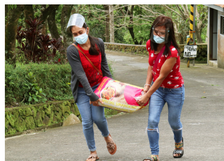
Due delle madri, nostre beneficiarie, portano un sacco di riso come parte del nostro pacchetto natalizio per le famiglie.